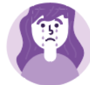
Dépression & Anxiété