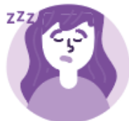
Sommeil & Fatigue